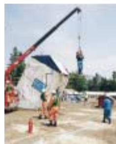
救助訓練は本番さながら

総合公園で各自治会の防災組織が集まり、自主防災訓練を実施しました。もしもの場合に備えた訓練に真剣に取り組んでいました。