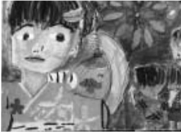
平成12年度小学校低学年の部 優秀作品