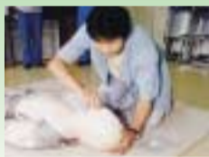
応急手当を学ぼう

「救急車のサイレンが聞こえない日はない」というほど、連日発生する事故。いつ自身や家族がその当事者になるかわかりません。突然の事故にもあわてず、救急車を呼んだり、応急処置をしたりするにはどうしたらよいのでしょうか。