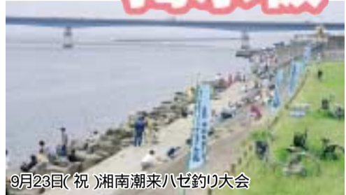
9月23日(祝)湘南潮来八ヶ釣り大会