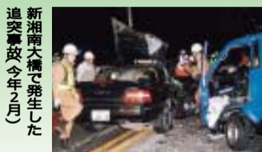
新湘南大橋で発生した追突事故(今年2月)