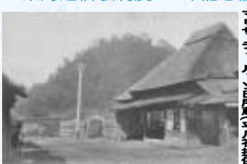
平塚駅より天狗山を臨む 了せたいん所蔵平氏墓