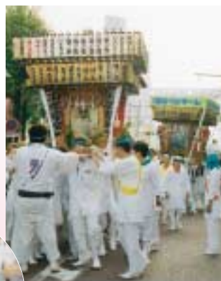
威勢良く練り歩くみこし

駅前中心街で夏まつりが開催されました。集まった人たちは、みこしや祭り大会などを楽しみ、残り少ない夏を満喫していました。