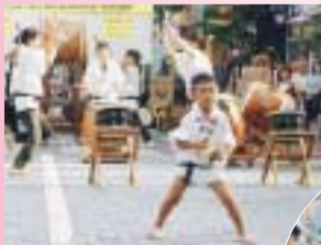
どつどつと釣れないの