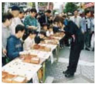
ちびっ子棋士も大健闘

パールロード商店街を会場に「囲碁まつり」が開幕。人気の「500面打ち大会」には全国から腕自慢が参加して、あこがれの棋士との対戦を楽しみました。