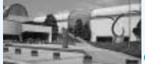
10周年を迎えた美術館

10周年を迎えた美術館 2001年3月、開館10周年を迎えた美術館をもっと利用するために、常設展や企画展の楽しみ方、市民アートギャラリーやミュージアムホールの利用方法、そして体験などを通じて美術に触れてもらう教育普及活動などについて紹介します。