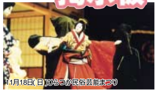
11月18日(日)ひらつか民俗芸能まつり