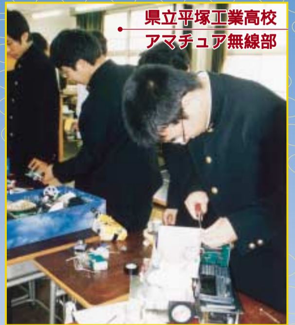
県立平塚工業高校 アマチュア無線部

人類の夢の実現に向け、科学技術は進歩し続け、ロボットと一緒に未来をつくる日は、もうすぐ。今年の産業まつりでは「ミニロボフェスタ」を開き、高校生の製作したロボットたちが登場します。身近なところから未来を見つめてみませんか。