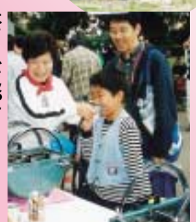
大きく息を吸って