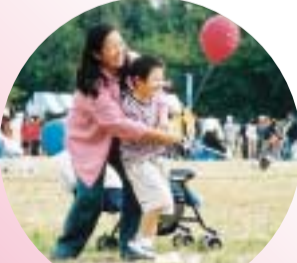
ナイス・ショット!

総合公園で健康とスポーツの一大イベントが開かれました。「健康づくりゾーン」や「スポーツ体験ゾーン」など健康に関する情報を満載。楽しみながら心と体をリフレッシュ!