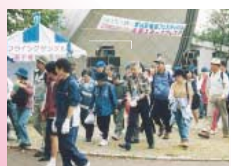
ウォーキングラリーに出発!