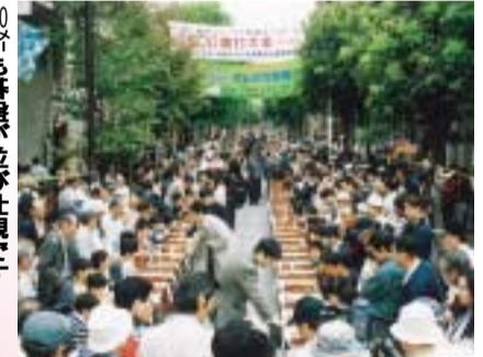
150名も善盤が並び壮観です