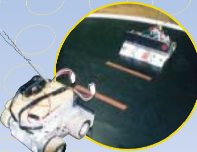
先着順でロボットの操作ができます

部員は、3年生4人、2年生5人の9人で、年に数回のロボットの大会に参加しています。代々先輩が作ったものに改良を重ね、より性能の良いロボット作りを目指しています。また、技能の向上やチームワークを大切に製作に励んでいます。ロボットの製作も、操作もおもしろいですよ。平成15年度に高校が統合され、この部もなくなります。その前に、みなさんにぼくたちの活動を知ってもらい、ロボットに親しみを感じてもらえたらうれしいです。