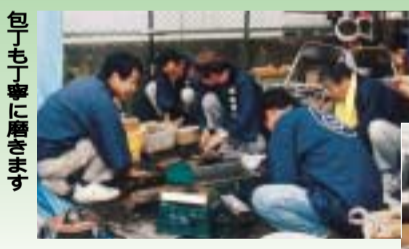
包丁も丁寧に磨きます