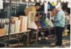
手作りの品物をどうぞ

長年、自分の技能を磨き働いてきた方々の技を披露する技能職団体奉仕市が開かれます。この奉仕市は、今年19回目で、10業種、11団体が参加します。 実演コーナーでは、包丁とぎや、まな板削りが人気です。ご家庭で使っているものを会場に持ち込んでいただければ、職人の技で磨き上げます。チャリティセールでは、手作りの品物をお安く販売します。日用品、工芸品などをご利用ください。ほかに、建物、自転車、自動車整備など各種技能相談もお受けします。すばらしい匠の技や技能文化にふれてみませんか。