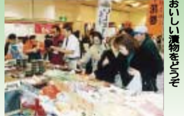
おいしい漬物をどうぞ

友好都市花巻を紹介する「花巻の物産と観光展」を開催します。花巻地方の観光紹介や郷土色豊かな物産の販売・実演のほか、毎日先着100人に花巻の特産品をプレゼントします。花巻の人と自然が守り育てた伝統の味と技をお楽しみください。 一般販売 民芸品、陶磁器、漆器、南部鉄器、菓子、漬物、地酒、ワイン、酒味うどん、わんこそば、りんご、米など 実演販売 こけし、野立薫、ガラス工芸品