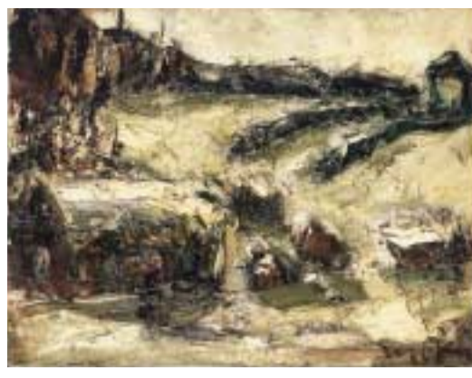
ちょうかいせいじ 鳥海青児「シベリア 駅路の雪」 えきじ 1930年/油彩・キャンパス 26.9×35.0cm

鳥海が初めてヨーロッパを訪ねる旅の途上、おそらく車窓から眺めた風景でしょう。当時、シベリア鉄道はアジアとヨーロッパを結ぶ最も早い交通路で、4月上旬に日本を出発した鳥海は5月にモスクワに入りました。日本では春を迎える季節に、まだ雪深い荒涼とした大地が広がるその眺めを大胆なタッチでとらえており、作品は小さいながら力強い存在感を示しています。モスクワからベルリン、パリと訪ねた鳥海は、やがてアルジェリアまで足を伸ばし、一年半とどまりました。ここでも鳥海をとらえたのは、広