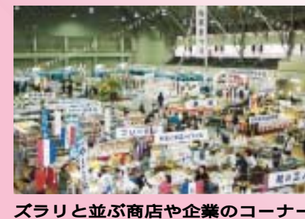
ズラリと並ぶ商店や企業のコーナー