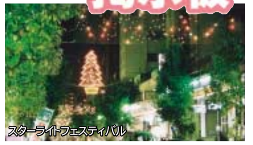
スターライトフェスティバル