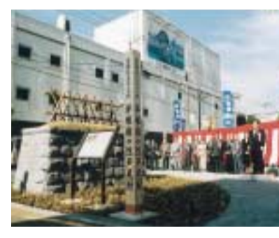
江戸には深き絵巻

東海道宿駅制定400年を記念して、市営見附町駐車場内に「江戸見附」が復元されました。「見附」は、平塚宿の出入り口で、宿を守る役割もありました。江戸時代の町並みを思い浮かべてみるのもいいですね。