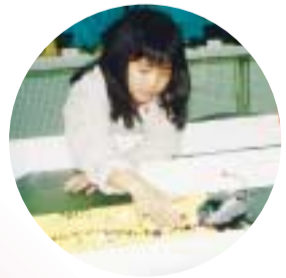
ワァー、かわいいロボット!

市内の産業を一堂に会し「産業まつり」が開かれました。市内企業の先端技術の紹介や商店・農水産業者の物品販売などに加え、ミニロボフェスタではロボットたちが会場を盛り上げました。