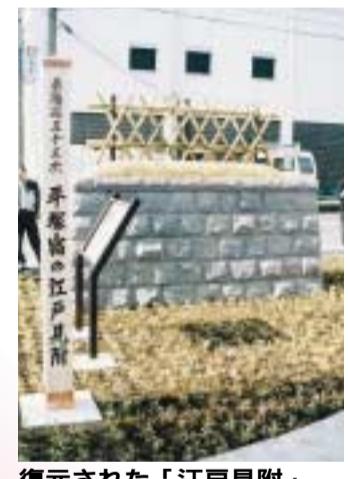
復元された「江戸見附」