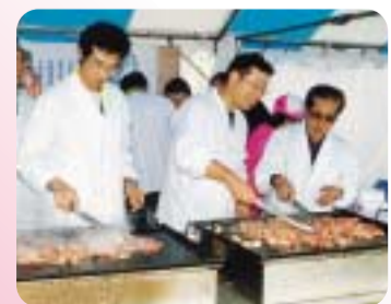
牛肉の消費拡大キャンペーン