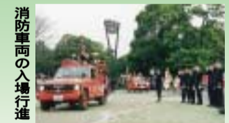
消防車両の入場行進