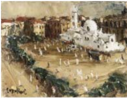
ちょうかいせいじ 鳥海青児「ゲobelmann広場」 1932年/油彩・キャンパス 21.2×27.2cm

1930年、鳥海はパリで、物を単純化して再構成するセザンヌと美しい色彩で感覚的なドラクロワの作品に接して感銘を受けます。共に当時のフランス美術界の伝統とは異なる新しいスタイルをつくりあげた画家でした。