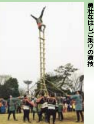
勇壮なはしご乗りの演技

平塚に新春の訪れを告げる「消防出初式」を総合公園で開催します。今年は、平塚古式消防保存会のみなさんの「はしご乗り」や「まといの振り込み」などに加え、古式消防ポンプの演技を披露します。華麗な演技をどうぞお楽しみください。