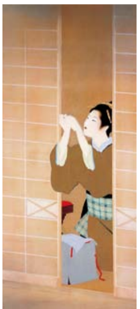
1941年 京都府立鴨沂高校蔵

本作品は7月21日(土)～8月12日(日)に上村松園と鏗木清方展で展示します。(文：市美術館学芸員 勝山)