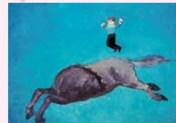
海老原喜之助「曲馬」1930年代

市美術館の所蔵品の中から、子どもをテーマにした約60点の作品を紹介し、さまざまな形で表現された子どもの姿をお楽しみください。また特別展示として、洋画家の川村清雄の幻の大作「滝」を初公開します。一般200円、高校生・大学生100円。