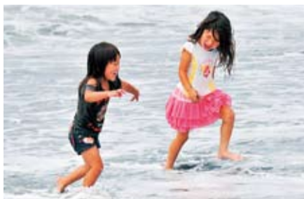
砂をまき上げフラッグを奪い合うビーチフラッグ大会の参加者や、波打ち際で遊ぶ子ども、ビーチバレーをする人。ハマヒルガオも浜辺を彩る。