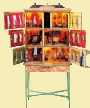
ハスケル・ハウス 18世紀後半

建物や部屋を縮小し、生活空間を正確に再現したドールズハウスの世界をお楽しみいただけます。