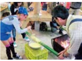
竹に生地を重ねます