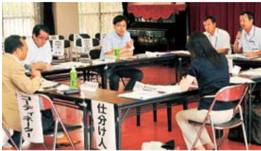
会場では、仕分け人から厳しい質問が相次ぎました

事業所管課による事業説明後、仕分け人が質問などをし、それぞれの事業を判定しました。仕分け作業の中心は、問題点を整理し論点を明確にする