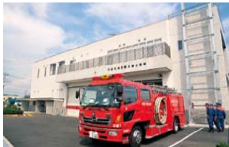
正面から見た大野出張所消防庁舎

新しい大野出張所には消防ポンプ車と救急車、災害対策車を各1台配備します。庁舎内には事務室や仮眠室、屋内訓練室、救急資機材の倉庫など