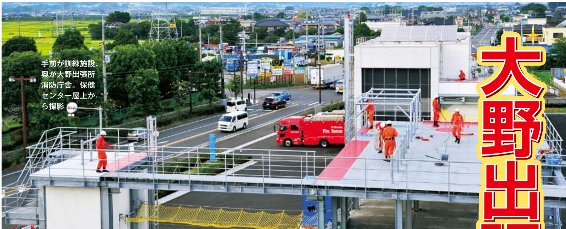
手前が訓練施設、奥が大野出張所消防庁舎。保健センター屋上から撮影