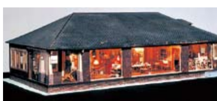
1932年頃 幅193センチ×奥行102センチ×高さ60センチ ▲家を4方向からのぞき込める ◀カーテン、壁紙、暖炉など、細かく作り込まれた内部

ルズハウスの制作に給料の大半を注ぎこみました。やがて、3人の子どもたちも制作に加わります。父親が家具を手作りし、母親はキッチンポットを、のみの市で見つけ、子どもたちは色塗りなどを手伝いました。モッツ・ファミリーが手掛けたドールズハウスの数々は評判を呼び、モッツ・ミニチュア・コレクションとして全米に知られるようになりました。