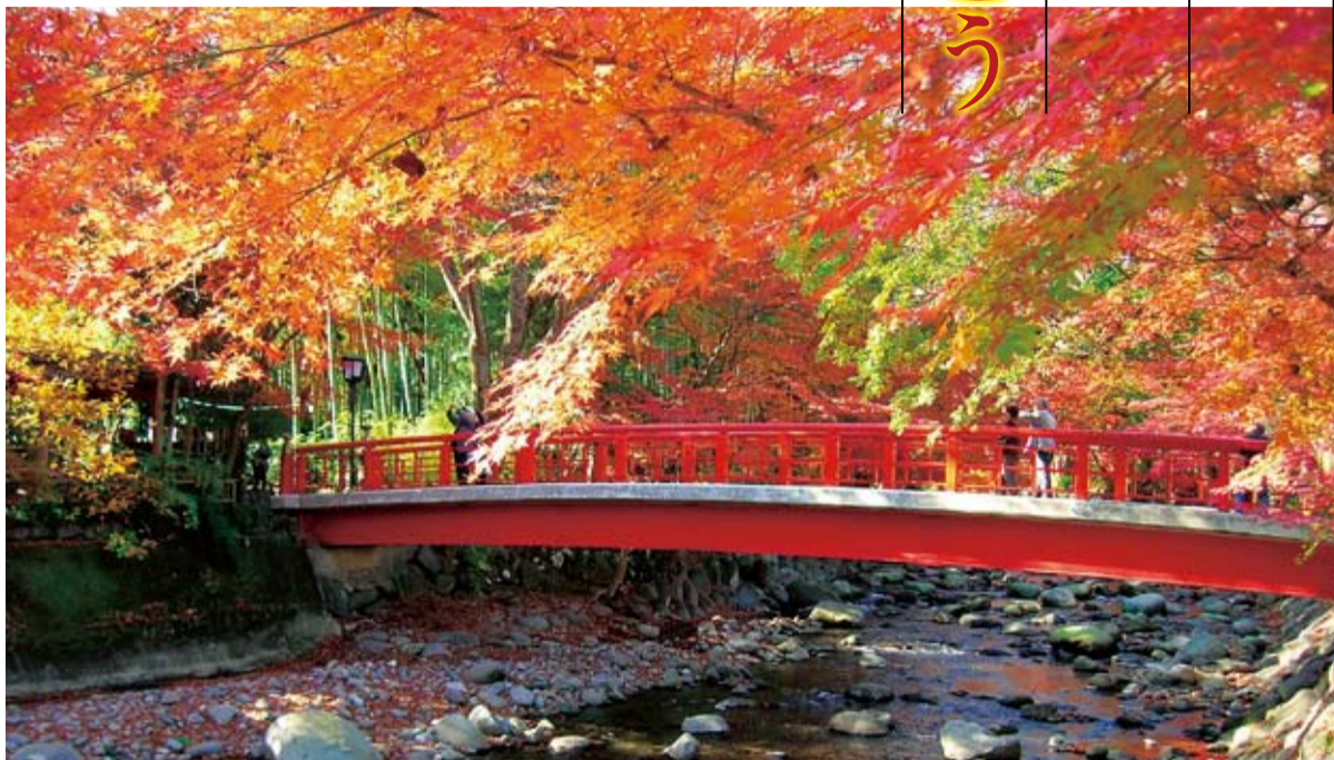
修善寺温泉の桂橋。兩岸を赤く染める紅葉は圧巻です。

①11月21日(水)午後3時②25日(日)午前11時③28日(水)午後3時にJR東海函南駅(静岡県函南町)集合。各日20人(先着順)。2泊3日6食付き。1万6000円。 【募】天城ふるさと広場 ☎0558-87-1050