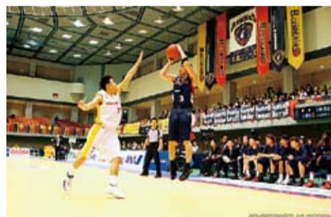
熱気あふれるプレーを間近で

は各地区の体育振興会②は平塚球場内のスポーツ課 ☎31-3060へ。 bjリーグ(日本プロバスケットリーグ) 横浜ビー・コルセアーズのホームゲームを応援しませんか。総合体育館。 富山グラウジーズ戦 12月1日(土)午後6時、2日(日)午後1時30分。 仙台89ERS戦 13日(木)