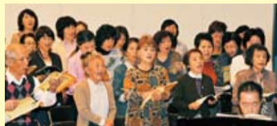
チケットは市民センター内の文化事業課 ☎32-2237などで販売します。全席自由1,000円。

市でも「第22回湘南ひらつか第九のつどい」を12月2日(日)午後2時から市民センターで開催。魅力