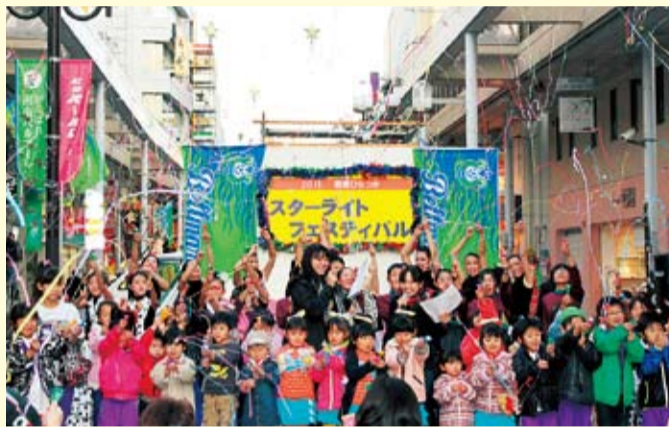
クラッカーの合図でイルミネーションを点灯します