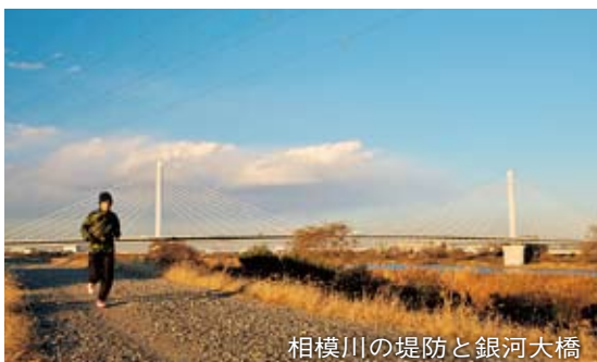
相模川の堤防と銀河大橋

東側の河川敷に降りれば、馬入の花畑や水辺の楽校などの風景を楽しめる。時間によつては野鳥の声を聞きながら走ることができるかも。花畑近くにトイレがある。