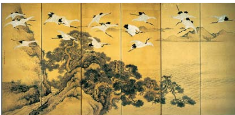
江戸時代後期 幅360センチ×高さ172.5センチ

この作品は2月11日まで、美術館で開催する「新春の所蔵品展 近世の書画 湘南の文人墨客」でご覧いただけます。芸員(文)市美術館学芸員(江口)