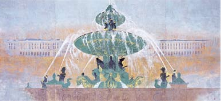
2005年 縦171.1cm×横363.6cm 彩色 紙