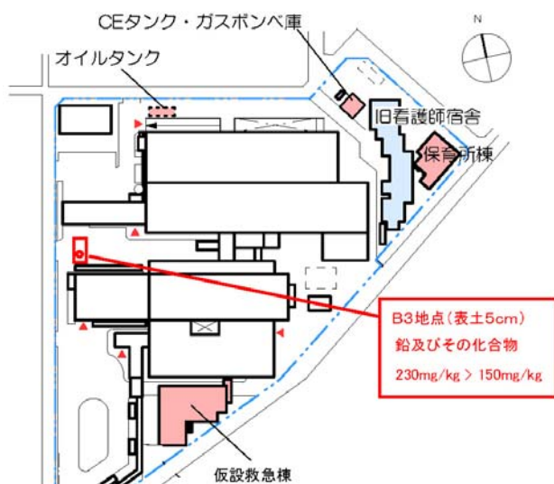
基準不適合地点図