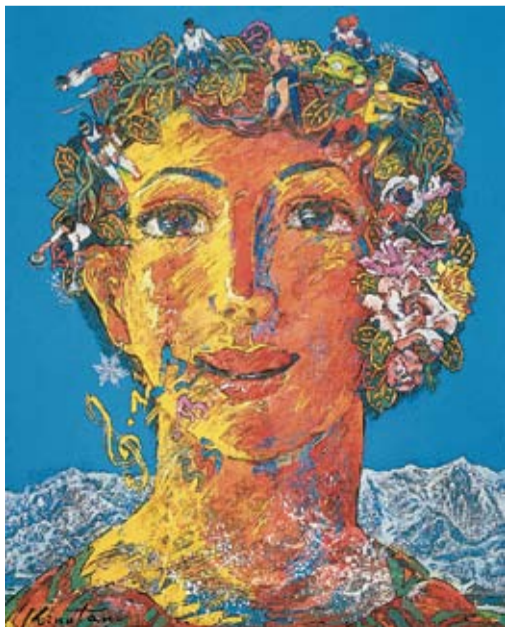
1997年 顔彩 カンバス 91センチ×72.8センチ

この作品は4月13日〜6 月2日の絹谷幸二展 希望 のイメージで展示します。 (文：市美術館学芸員 勝山)