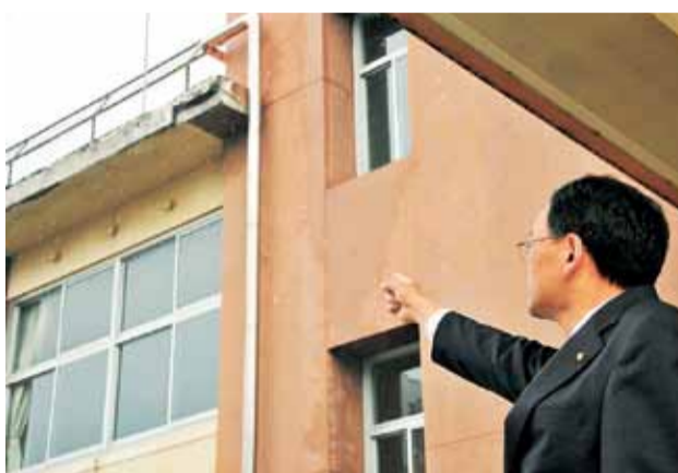
築52年が経過して外壁が一部はがれている浜岳中学校北棟

建物の長寿命化には定期的な改修工事が必要です。市立小・中学校43校の校舎と体育館では、これまで耐震化工事を優先してきましたが、平成24年度で工事が完了しました。本年度からは校舎の寿命を延ばすための改修工事に着手します。