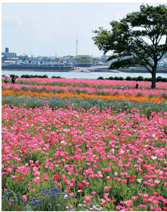
満開のポピーが河川敷を彩り、参加者を迎えます

5月14日(火)午前9時15分 午後0時30分。午前9時集 合。当日午前7時ごろの横浜 の降水確率が50%以上の場合