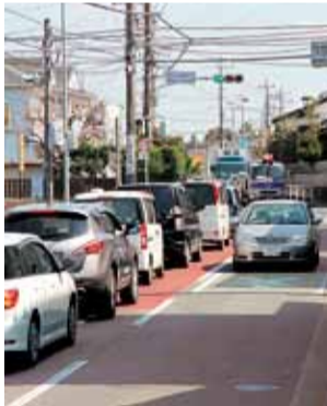
右折帯が設置される真土小学校入口交差点