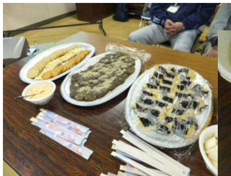
↑つきたてのお餅3種