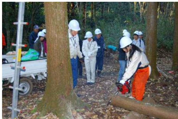
チェーンソー体験講習