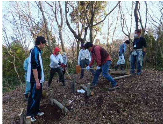
散策路の休憩スポット整備