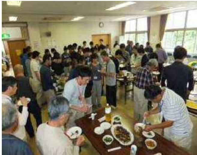
→大葉とジャコのチリシ