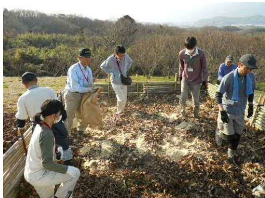
落ち葉堆肥づくり