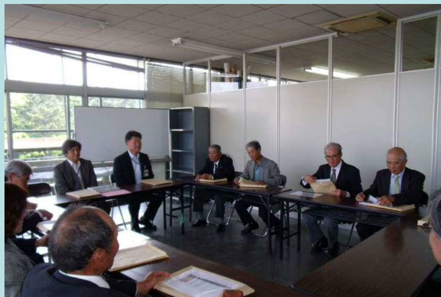
まちづくり政策部との面談の様子