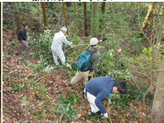
散策路の下草刈り