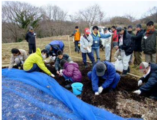
カブトムシの幼虫探し