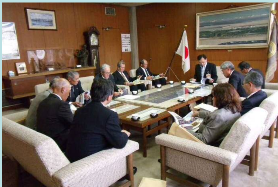
落合市長との面談の様子