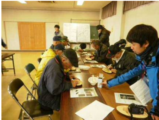
樹名板づくり、設置