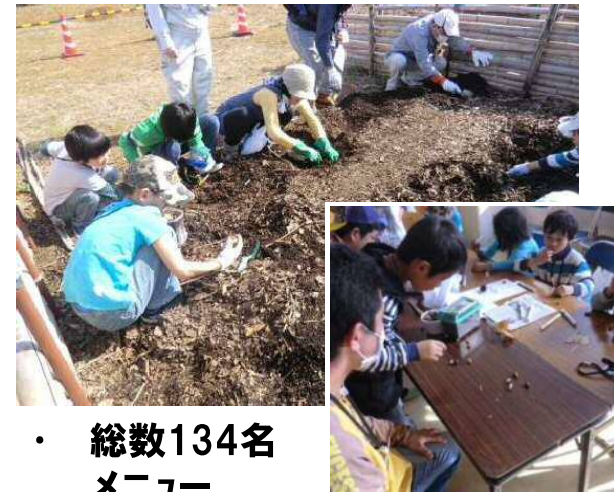
カブトムシの幼虫さがし、どんぐりこま作り