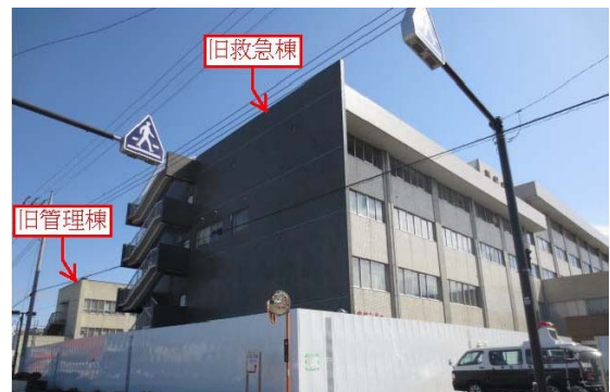
奥が旧管理棟、手前が旧救急棟です。 (平成25年4月4日(木)) 病院の南西側から撮影)