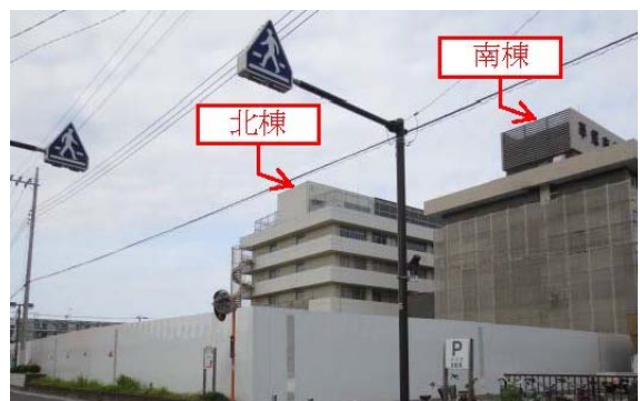
旧管理棟と旧救急棟が解体され、北棟と南棟が見えている状態です。 この跡地に新棟が建ちます。 (平成25年7月2日(火)) 解体前と同じ方向から撮影)