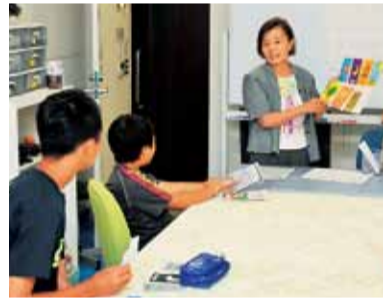
寺子屋教室「英語で遊ぼう」

しかし、不況のあおりを受け、近年、仕事の受注が減ってきています。そこで、仕事を「もろう」だけでなく、仕事を「開拓」することに力を注いでいます。その試みの一つが平成24年11月から始めた、1面の「寺子屋教室」です。子どもだけでなく、働く世代や同世代にも、自分たちの経験