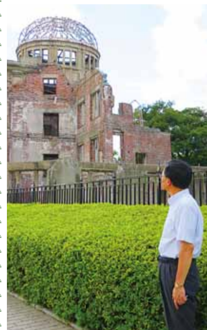
広島で平和の尊さを再認識しました