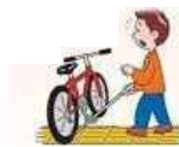
進む方向を示すブロック（左）と止まる位置を示すブロック（右）