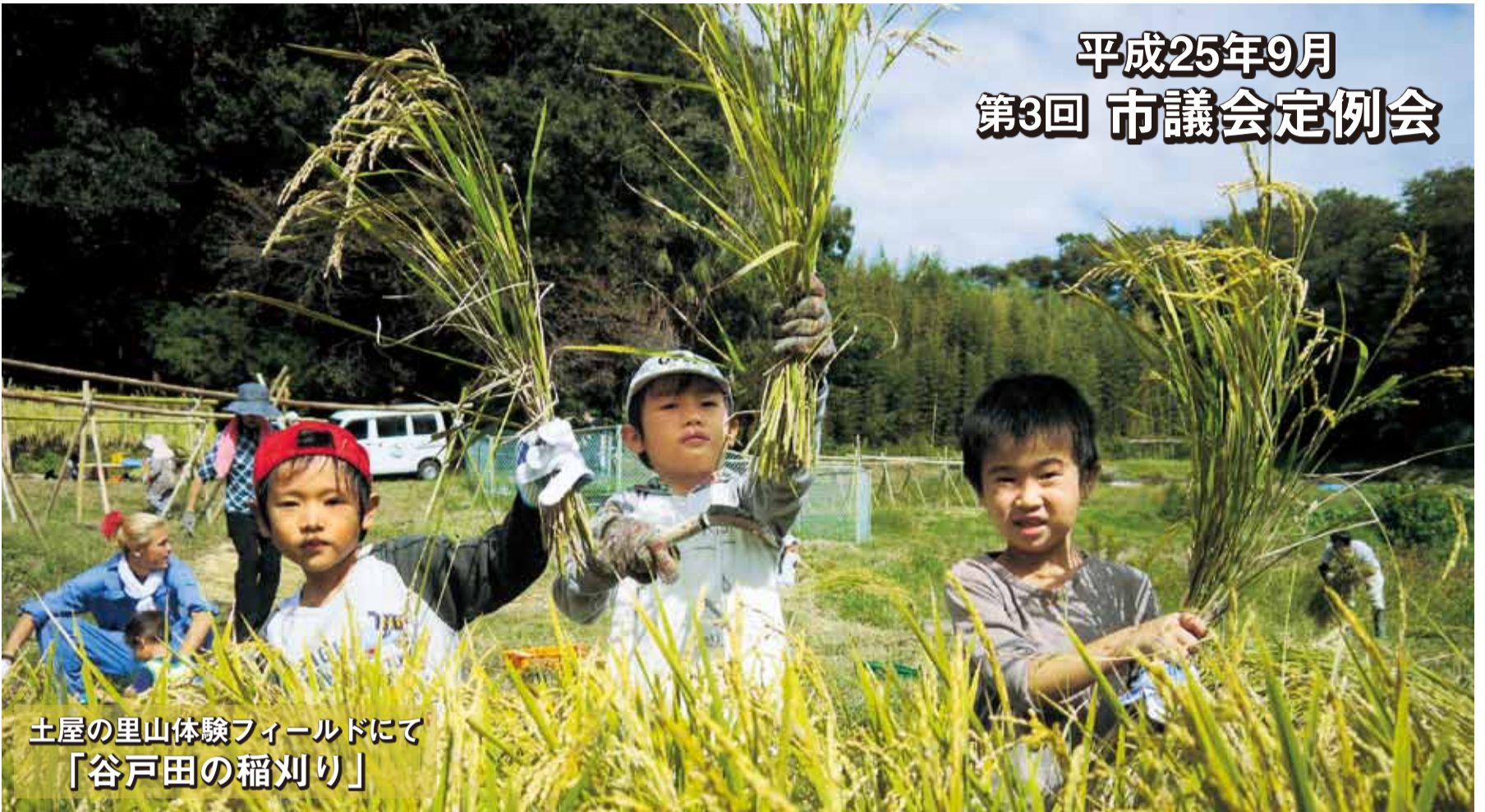
土屋の里山体験フィールドにて 「谷戸田の稲刈り」