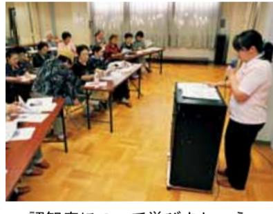
認知症について学びましょう

体操など。ブックスタートも同時開催します。18日(水)午後1時30分～3時15分。5～6カ月児。 ◆離乳食教室(予約制) 離乳食の進め方など成長に合わせたコースです。 ★5～6カ月児 25日(水)午後1時30分～2時40分。 ★7～8カ月児 13日(金)午後1時30分～3時。 ★9カ月児～1歳6カ月児 20日(金)午前10時30分～11時30分。 ◆歯つばい はみがき教室(予約制) 歯の手入れについて学びます。7日(土)午前10時～11時。1歳3カ月～1歳6カ月児。歯みがきイヤイヤ克服編。