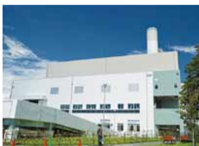
整備を進めてきた新環境事業センターは平成25年10月から本格稼働