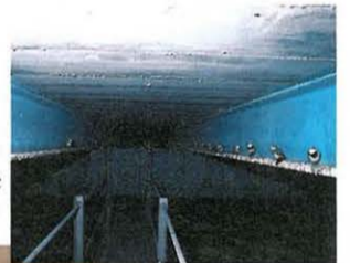
橋げたの「ねぐら」で休むハクセキレイ(写真右)。昼間は岸边などで一年中姿を見かける