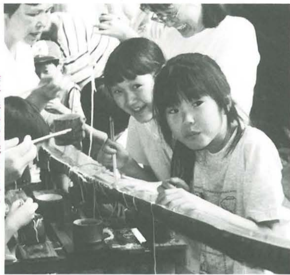
昨年も行われた流しそうめん

びわ青少年の家を会場にして、バーベキューや流しそうめん、キャンプファイヤーやウォークラリーなどを行う「親子ふれあいキャンプ」が開催されます。 日程は七月二十日(土)午前十一時三十分から二十一日(日)午前十時四十分まで の一日二日。対象は市内にお住まい、または通学する小学生とその親で、定員は先着順に四十人。参加費は一人二千円です。 申し込みは、参加費を添えて、びわ青少年の家(土屋二七〇一・☎5910871)、または青少年会