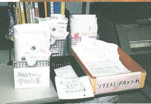
▶リクエストのはがきやファクスがこんなにたくさん