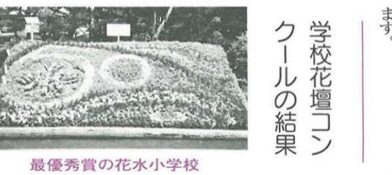
最優秀賞の花水小学校

児童・生徒の緑と花に対する意識を高めるとともに学校の緑化を進めることを目的に、平成八年度学校花壇コンクールが行われました。参加六校。 ▽最優秀賞 花水小学校 ▽優秀賞 などでし小学校、八幡小学校 ▽優良賞 崇善小学校、城島小学校、神明中学校