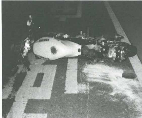
カーブで対向車線にはみ出した二輪車が対向乗用車に衝突。運転手が死亡