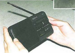
▶AM放送も入る専用ラジオは、ナパサ(MNビル内)で販売中