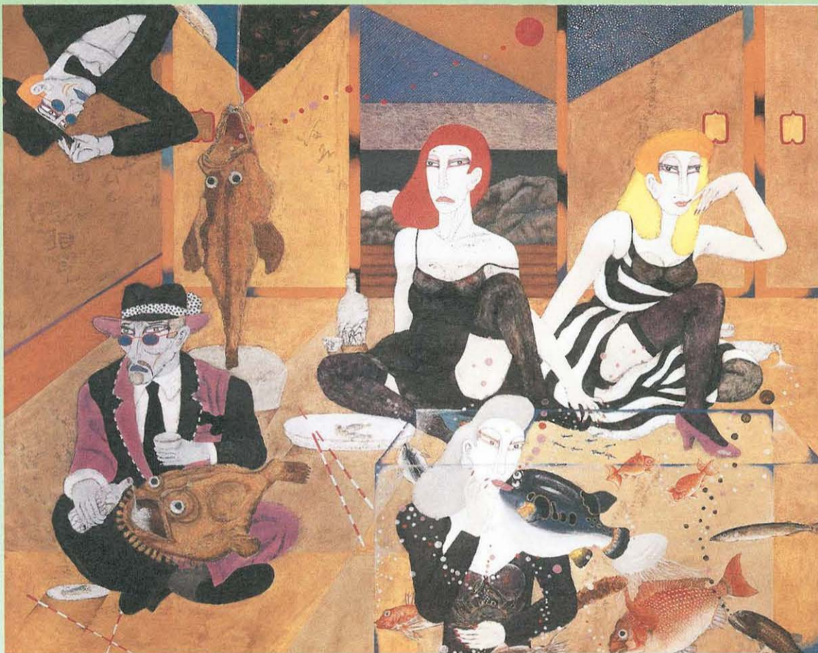
「魚眠館異聞」 1998年 アクリル・キャンバス