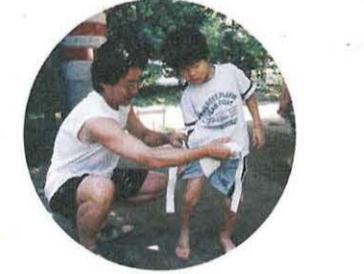
お父さん、手伝って

8月8日(火)〜10日(木) 「友好都市子どもマリン交流」 高山・花巻・平塚の小学生が、ビーチフラッグ遊びや遊漁船で海鳥の観察など平塚の海を楽しみました。「海を見るのは初めて」という高山・花巻の子もいて、波打ち際で大はしゃぎ。