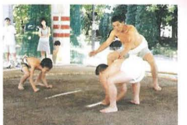
立ち会いは、「はっけよい」の掛け声で

8月8日(火)・24日(木) 「親子1日相撲教室」 総合公園相撲場で、小学生と保護者を対象に相撲教室が開かれました。本物の力士に負けないうらい正々堂々とした迫力満点の豆力士の姿に保護者も感激。昼食には、ちゃんこを食べ夏の暑さを吹き飛ばしていました。