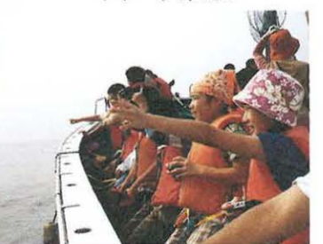
鳥さん、こっちに来て