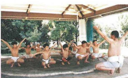
正々堂々と戦う心がまえを示す塵浄水