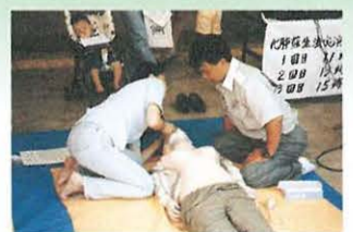
心肺蘇生法の講習

「救急医療週間(9月3日〜9日)」「救急の日(9月9日)」にあわせて救急医療や救急業務・応急手当などを紹介する救急フェアを開きます。救急車が到着に要する時間は、約6分(全国平均)。人体の臓器は、血流の低下・停止による低酸素や無酸素の状態に弱く、特に脳は、わずか3〜4分間の血流停止でも、回復することが困難になります。心臓や肺の機能の停止や大出血の場合は、生命の危機が極めて大きく、すべてに優先してその場に居合わせた人により応急手当が実施されることが重要です。この機会に正しい応急処