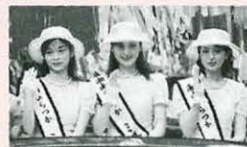
今年のミス七夕 SCN ☎22-1213(代)

◆姉妹都市ローレンスとの交流 アメリカ・カンザス州にある姉妹都市ローレンス市と平塚市との様々な交流を紹介します。