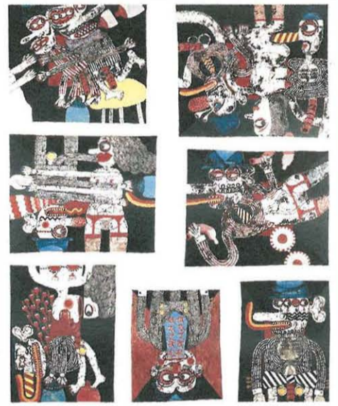
「H氏の優雅な生活」 1968～69年 油彩・キャンバス (株)フマギャラリー蔵