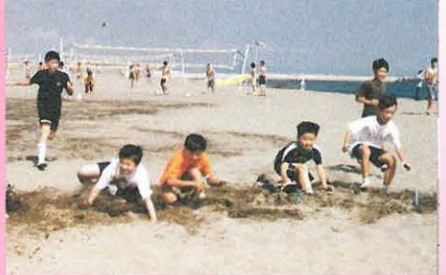
先にとったら勝ちだ、ビーチフラッグ遊び