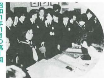
第4尋常小学校創立のころ