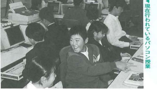
現在行われているパソコン授業

「青少年に夢を、大人に希望を、お年寄りに生きがい」を、当時の平塚市政のスローガンだった。新学制で保障された教育の機会均等の理念を具体化すべく、「平塚市を障害児教育のメ