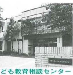
子ども教育相談センター

「子ども教育相談センター」が新設された。かくて当市の障害児教育は、質量とも全国に誇れるものに拡充されたのである。