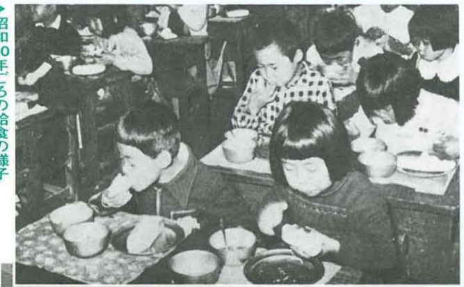
昭和30年ころの給食の様子

昭和四十三年、私もは新学制施行以来二十数年間にわたって、かたくなに守られてきた二十五の学区を再編成して四十三とする計画を策定し、年次を追って学習環境を改善することにした。私が在任した八年間は継承され、ほぼ当初の計画どおり、さらに十二校が開校された。大きな混乱もなく、この大事業が完遂されたことを、今、感謝の気持ちをもって思い出す。