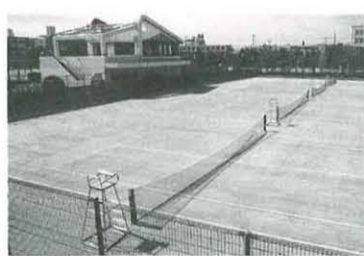
国体テニス会場・桃浜町庭球場

平塚市テニス協会では、平成10年に平塚市で開催する「かながわ・ゆめ国体」のテニス会場となる桃浜町庭球場を使ってジュニアテニス練習会を開催します。ぜひ、ご参加ください。