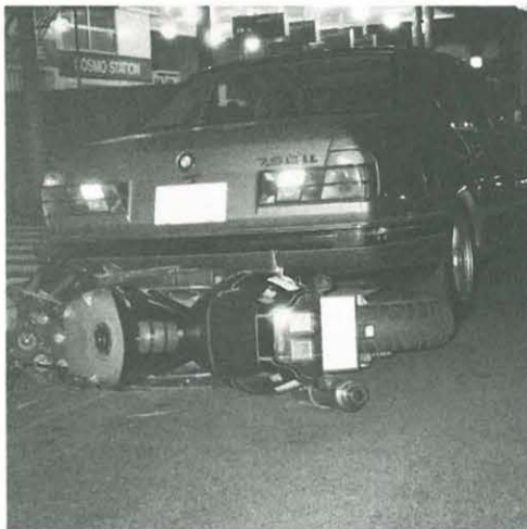
二輪車が関係する事故が増えています