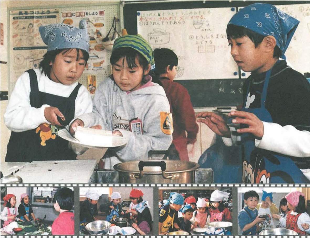
富士見小学校1年4組の生活科「ほうれん草のみそ汁づくり」で、このほうれん草は、種まきから収穫まで子供たちの手で行いました。

今年四月に市内の小学校に入学する新一年生は、およそ二千五百人です。新入学児のいる家庭では、健康や集団生活、友達つきあいや交通事故など、心配の種がつきないことと思います。そこで、入学にあたって考えておいていただきたいことを、いくつか紹介します。