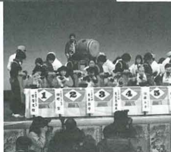
花巻市のわんこそば大会