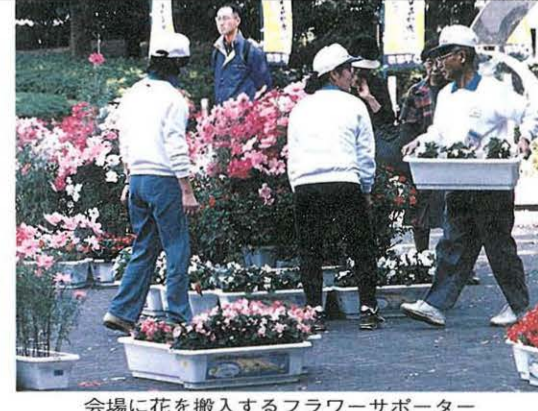
会場に花を搬入するフラワーサポーター

現在、150人のみなさんがフラワーサポーターに登録しています。昨年のリハーサル大会では、各家庭で育てられた花が会場を飾りました。 国体事務局では、本大会に向けて、フラワーサポーターを追加募集します。 ☆募集人数 100人(先着順) ☆活動内容 ①ご家庭で会場飾花用の花をプランターで育て、大会前に競技会場へお持ちいただきます ②大会終了後は持ち帰り、ご家庭で利用していただきます ☆支給品 1人2プランター(栽培は種、苗の2種類。講習会あり) ☆問い合わせ先 国体事務局国体推進課 ☎23-1111(内線152)