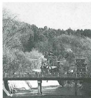
飛騨の小京都「高山市」