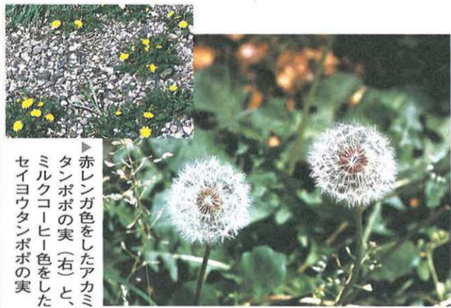
赤レンガ色をしたアカミタンポポの実(右)と、ミルクコーヒー色をしたセイヨウタンポポの実

春たけなわとなりました。タンポポは、丘陵地の野道から市街地の空き地や道のかたわらまで、至る所で咲いています。 タンポポには、昔から日本にあった在来種のカントウタンポポと、明治時代にヨーロッパから持ち込まれた帰化種のセイヨウタンポポがあることがよく知られています。帰化種には、アカミタンポポという別の種類もあり、セイヨウタンポポとは実の色が違うという微妙な点だけで区別できます(写真参照)。 大雑把にいうと、昔ながらの環境がよく残されている地域には在来種が、都市化の進んだ地域には帰化種が多く見られます。そうした意味で、タンポポは自然環境の指標としても