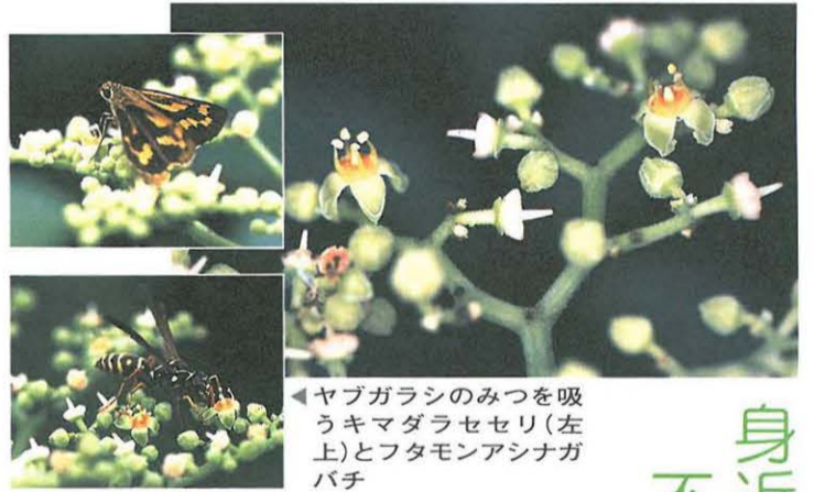
◀ヤブガラシのみつを吸うキマダラセセリ(左上)とフタモンアシナガバチ