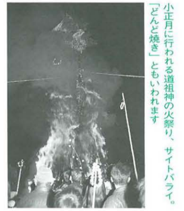
「どんど焼き」ともいわれます。小正月に行われる道祖神の火祭り、サイトバライ。