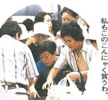
私もこのこんにやく買うわ。