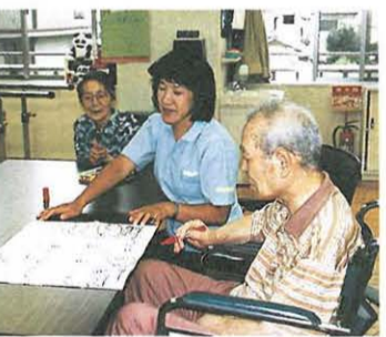
ビンゴゲーム。お題は「屋台」

9月19日(日) 「ふれあいマーケット<朝市>」 毎月1回、恒例の朝市。平塚産の野菜や魚、果物など新鮮なものばかりです。早めに行かないと売り切れてしまいます。