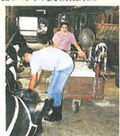
酪農は365日休みなし

◆TAIKEN通信出演者を募集 対象は、市内在住、在学中で18歳〜30歳の方(高校生は除く)。履歴書に応募動機を記入して広報広聴課(市役所3階・☎21-8761)へ。