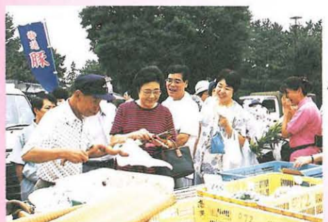
おじさん、広報ひらつかに載ってたね。

9月19日(日) 「ふれあいマーケット<朝市>」 毎月1回、恒例の朝市。平塚産の野菜や魚、果物など新鮮なものばかりです。早めに行かないと売り切れてしまいます。