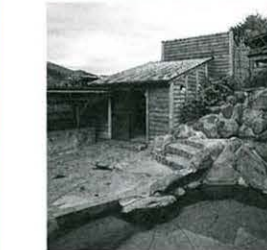
ひらつか天城山荘