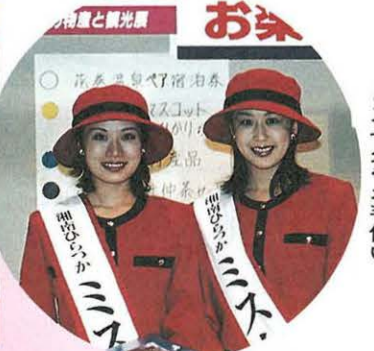
この漬物はおいしいのよ