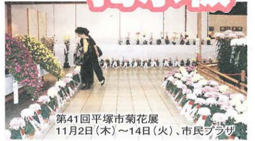
第41回平塚市菊花展 11月2日(木)～14日(火)、市民プラザ