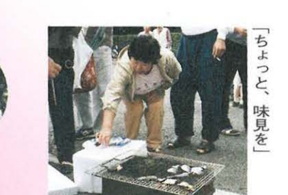
「ちょっと、味見を」 今日は朝市で朝食!

10月15日(日) 「湘南ひらつかふれあいマーケット」 今年4月から、毎月第3日曜日に総 合公園南駐車場で開催されている「湘 南ひらつかふれあいマーケット」。 新鮮な地元の味覚を楽しめるだけ でなく、たくさんの笑顔に出会える心 温まる朝市です。 今回は秋の収穫祭。賞品が当たる 抽選会もあり、大盛況でした。