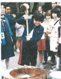
きねとうすでもちつき体験▶