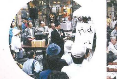
わかりやすい解説に感心