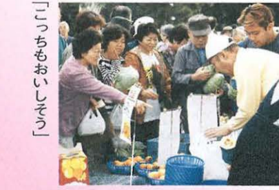
「こっちもおいしそう」

10月15日(日) 「湘南ひらつかふれあいマーケット」 今年4月から、毎月第3日曜日に総 合公園南駐車場で開催されている「湘 南ひらつかふれあいマーケット」。 新鮮な地元の味覚を楽しめるだけ でなく、たくさんの笑顔に出会える心 温まる朝市です。 今回は秋の収穫祭。賞品が当たる 抽選会もあり、大盛況でした。