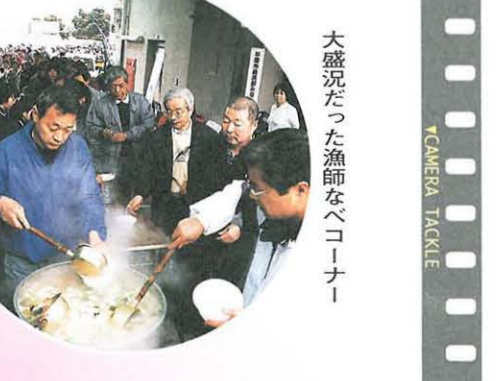
大盛況だった漁師なべコーナー