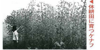
休耕田に育つケナフ

◎日程 5月13日(木)～18日(火) ◎時間 午前10時～午後6時30分(最終日は午後3時まで) ◎会場 市民プラザ 問 産業推進課(内線3581)