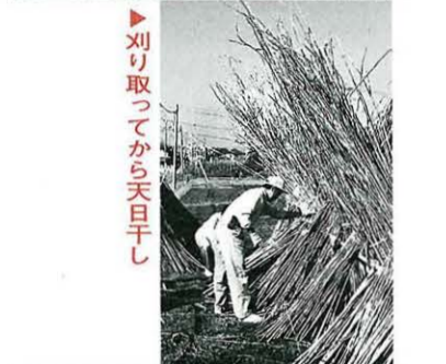
刈り取ってから天日干し