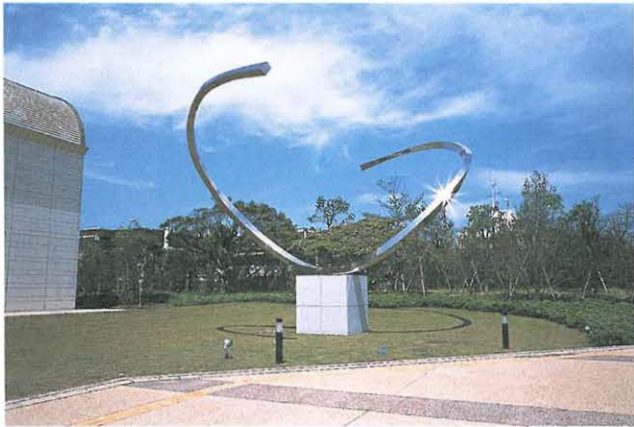
ホセ・デ・リヴェラ (1904-1986) 「コンストラクション #115」 1969年作 ステンレス・スティール

もしあなたが「光」や「時間」を形にしたいといわれたらどうしますか。アメリカ人のリヴェラは、このように抽象的なものを彫刻で表現した人です。「湘南の美術と光」をテーマに美術館が開館したとき、彼の作品はそのシンボルとして建てられました。