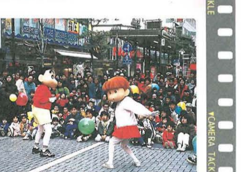
ちびっこに大人気のクレヨンしんちゃんショー