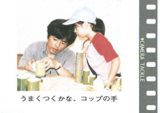
うまくつくかな、コップの手