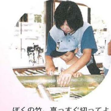
ぼくの竹、真っすぐ切ってよ