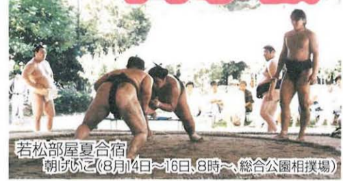
若松部屋夏合宿 朝拝(8月14日~16日、8時~、総合公園相撲場)

●油絵を楽しみませんか 毎月第1・3水曜日、13時30分~15時30分/福祉会館/月会費二千五百円/岡まちえいの会の内田(☎)5787