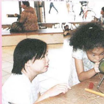
しっぽをつけるとキリンの完成ね