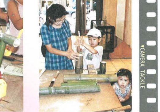
お母さん、しっかり支えてね