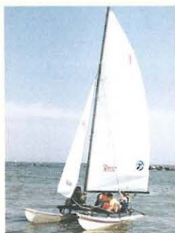
カタマランヨット

土曜・日曜日には、カタマランヨット、スキムボード、サーフィン、ルアーフィッシングなど体験講習会(無料)が随時開かれます。申し込みは、当日、直接ビーチセンター内の事務所へ。