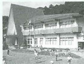
びわ青少年の家 SCN ☎22-1213(代)

◆TAIKEN通信の出演者を募集! 市内在住、在学の18~30歳の方(高校生は除く)。履歴書に応募動機を記入して広報広聴課(市役所3階・☎21-8761)へ。