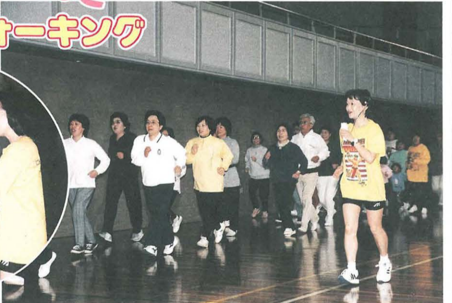
みなさん、はりきってウォーキング