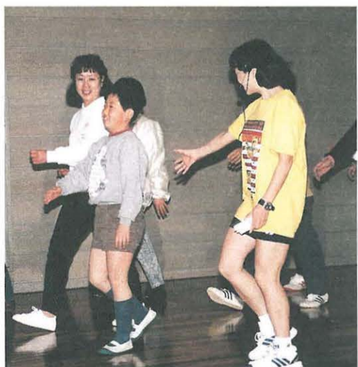
子供にもやさしく声かけ