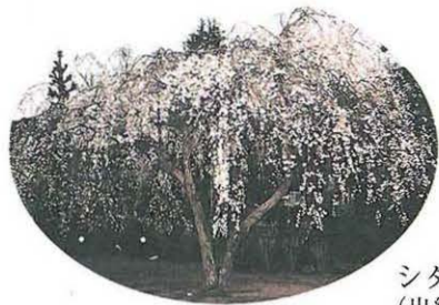
シダレザクラ (出縄 蓮大寺)