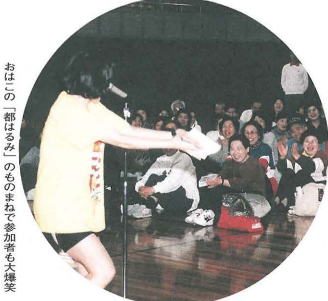
おはこの「都はるみ」のものまねで参加者も大爆笑