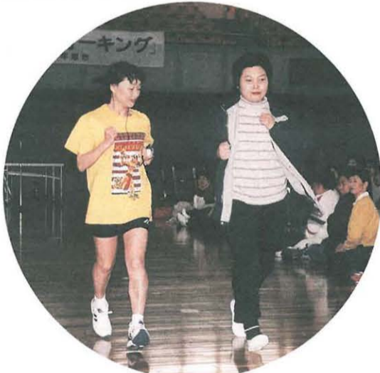
みんなの前を参加者とウォーキング