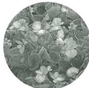
国体推奨花ベゴニア

◎活動内容 講習会参加後、平成9年高等学校野球リハーサル大会・10年本大会の会場を飾るためのプランター花の栽培・育成 ◎支給品 年度ごと、1人につきプランター2鉢、苗、種、土等 ◎応募方法 各地区公民館に置いてある「フラワーサポーター応募用紙」で申し込む(電話の場合は、直接国体事務局へ) ◎応募先および問い合わせ先 平塚市役所国体事務局内「フラワーサポーター募集係」(〒254平塚市浅間町9-1 ☎23-1111内線152)