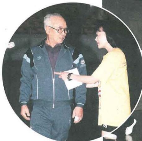
姿勢を個別に指導も