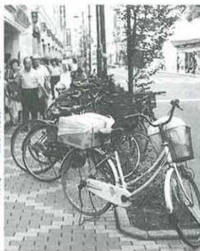
他市の迷惑駐輪を視察

市政に対するみなさんの声をお聴きするため、市政モニターを募集します。 主な活動内容は、①市民のみ