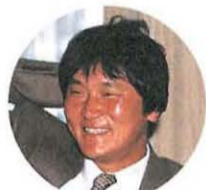
趙治勲 棋聖・名人・本因坊