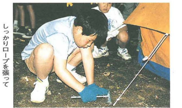
僕にもやらせてよー!