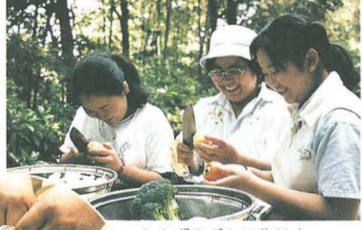
おかずのポトフ作りもみんなの手で