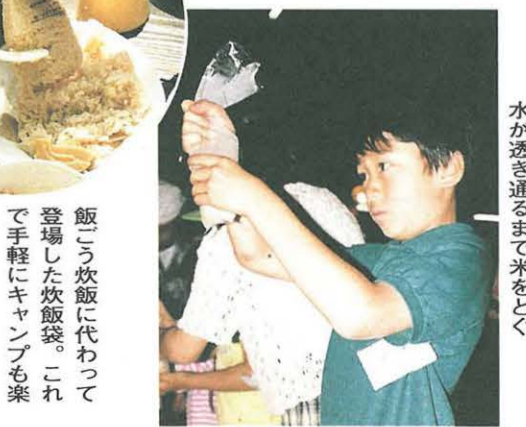
水が透き通るまで米をとく

飯こう炊飯に代わって登場した炊飯袋。これで手軽にキャンプも楽しめる!? 隣りのご飯のできればは? しっかりロープを張って