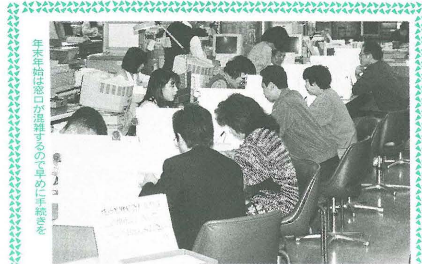
年末年始は窓口が混雑するので早めに手続きを

◆国産品を 塗装看板業組合 二万六千二百六十九円、平塚左官組合 七千九百三十三円、湘中央表具内装協同組合 七千九百円、自転車商協同組合 平塚第1・第2支部 五万三千七百円、中央印章業組合 三千二百二十円、湘南平塚畳工業組合 一万九千二百五十円、湘南中央広告美術協会 一万六千五百円、頼朝屋 五千円、プロパンガス協会湘南支部平中地区部 六万五千七百八円、代官町母親クラブ 一万円、湘南農業協同組合八幡生産組合 同 三千九百九十三円、五領ヶ台高校生徒会 二万八千九百一十一円、平塚テニス協会 二万一千五百円、湘南アルテック 二千五百円、緑化標語・ポスター展 一般寄付 四千八百八十三円、緑化表彰式 一般寄付 五千九百八十四円、ガス事業協同組合 十万円、金目公民館窓口 一般寄付 一千二百九十九円、産業まつり 一般寄付 一万八千九百五十八円、みどり公園課窓口 一般寄付 一千七百七十五円