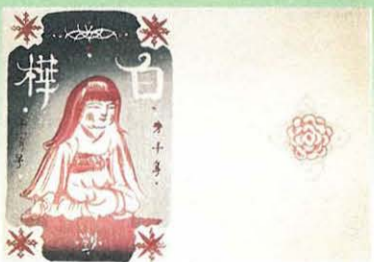
「白樺」第10年11月号 表紙(麗子坐像) [木版画、1919年(大正8年)]

この展覧会では、劉生が自らすすんで描いたという武者小路実篤の「幸福者」や「友情」の表紙木版画をはじめ、白樺派の長与善郎の「生活の花」など初期の代表的な装幀木版画に加え、河野通勢が手がけた倉田百三の「布施太子之入山」、