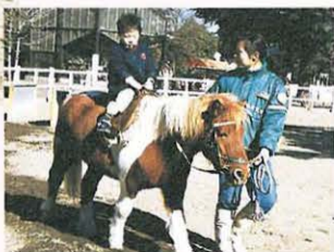
怖くないよ。だいじょうぶ