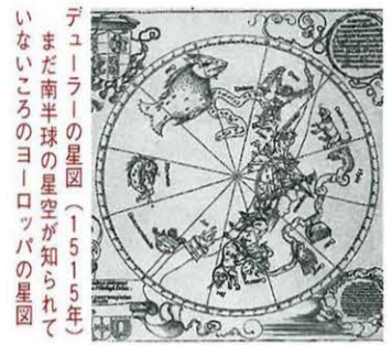
デューラーの星図(1515年) まだ南半球の星空が知られていないころのヨーロッパの星図