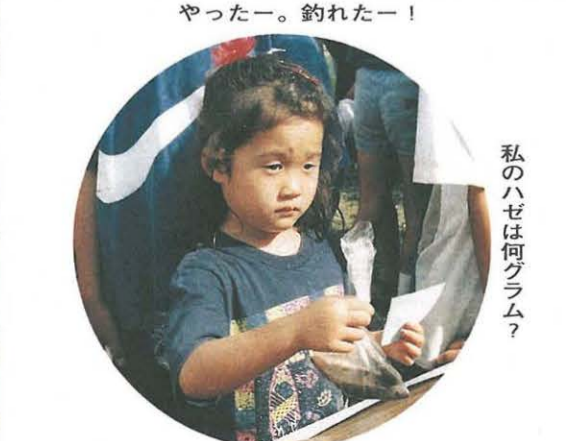
チャンピオン決定!