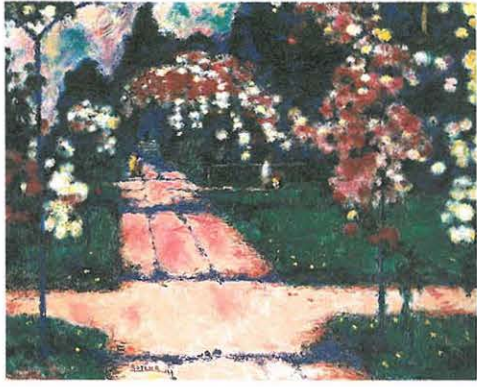
青山義雄 「バラアーチ」 1990年/油彩・キャンバス/64.8×81.0cm

今からもう80年近く前、青山はフランスに渡って絵の勉強を始めました。ベル・エポック(美しい時代)と呼ばれた1920年代のヨーロッパは芸術運動が盛んで、ピカソやルノワールといった優れた画家たちが活躍していました。青山はマティスから絵の才能を認められ「この男は色彩を持っている」と言われたといひます。この美しい作品「バラアーチ」を見れば、そのことがよくわかります。