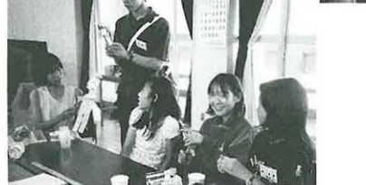
みんなでワイワイ楽しいよ