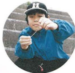
エサや仕掛けが、大事なんだ

9月23日(土) 「第28回湘南潮来ハゼ釣り大会」 平塚八景の一つ湘南潮来(相模川馬入橋下流)を会場に、ハゼ釣り大会が開かれました。子どもも大人もみんながハゼ釣り名人、仕掛け作りも念入りです。釣り上げた瞬間、思わず笑みがこぼれます。