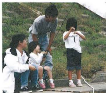
おねえちゃん、ハゼ、釣れたよ