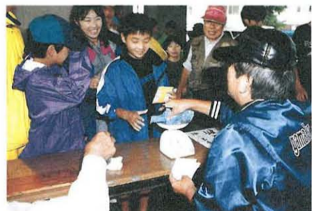
5匹で202g。小学生の部で優勝だ

9月23日(土) 「第28回湘南潮来ハゼ釣り大会」 平塚八景の一つ湘南潮来(相模川馬入橋下流)を会場に、ハゼ釣り大会が開かれました。子どもも大人もみんながハゼ釣り名人、仕掛け作りも念入りです。釣り上げた瞬間、思わず笑みがこぼれます。