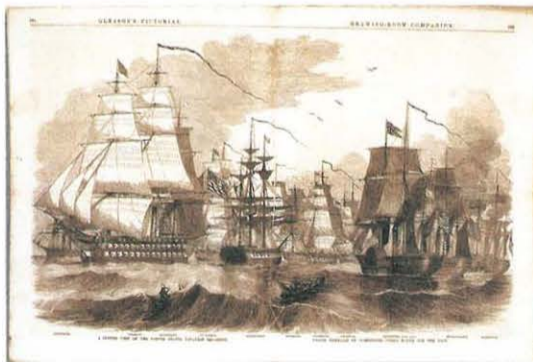
ペリー提督指揮下のアメリカ合衆国日本遠征東インド艦隊

日本の歴史のなかで幕末・開港期という激動の時期の、神奈川・東海道をはじめ、日本の文化をヨーロッパやアメリカの人がどのように見ていたのか、神奈川大学図書館が所蔵する洋書貴重書や平塚市博物館が所蔵する東海関係の絵図や文書などの資料を展示し紹介します。