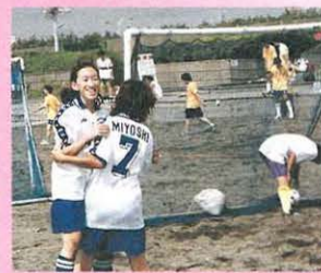
はいった、はいった、ゴールよ

9月24日(日) 「ベルマーレカップ ビーチサッカー2000湘南大会」 湘南ひらつかビーチパークで開かれたビーチサッカー大会。砂の上では、足を取られたり、ボールも思ったように転がらなかったり、選手は大変です。