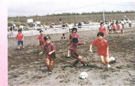
よーし、二人を抜いちゃうわ

9月24日(日) 「ベルマーレカップ ビーチサッカー2000湘南大会」 湘南ひらつかビーチパークで開かれたビーチサッカー大会。砂の上では、足を取られたり、ボールも思ったように転がらなかったり、選手は大変です。