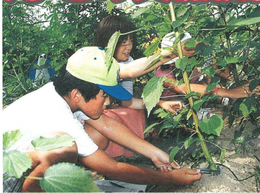
小学生への「ケナフ」普及と製紙化体験講座