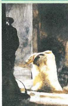
「穀物袋」1961年 水彩 ©wyeth

アメリカン・リアリズムの代表的作家 アンドリュー・ワイエス(83歳)。現在も写実的で詩情豊かな画風で飾り気のない素直なアメリカの田園生活を描き続け国民的な人気を得ています。