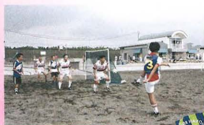
チャンスだ、センターリングだ