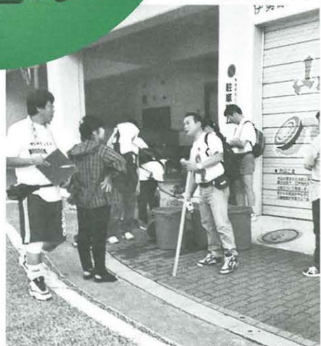
▼金旭学区教育ネットワーク 子どもと大人く「大山ナイト」

「骨粗しょう症」の予防には運動がよいと聞きました。 どのような運動を、どれくらいすればよいか教えてください。