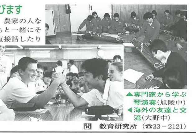
▲専門家から学ぶ琴演奏(旭陵中) ▲海外の友達と交流(大野中)

地域の人から学びます 漁師さん、大工さん、農家の人など地域で活躍する人たちと一緒にその仕事を体験したり、直接話したりすることで、人生の夢や希望がふくらむ豊かな生き方をはぐくんでいきます。また、地域の人たちに学校行事や学習活動の支援などのボランティアを呼びかけていきます。