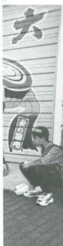
7議会 しながら歩 」