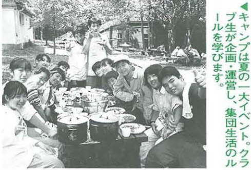
キャンプは夏の一大イベント。クラブ生が企画・運営し、集団生活のルールを学びます。