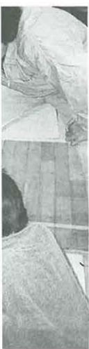
5会 やかに育つ 込められた 会」

これからの地域社会は、単に人々の地縁の結びつきによる活動だけでなく、同じ目的や趣味・関心に応じて大人たちを結びつけ、そうした活動の中で子どもたちを育てていくことも考えなければなりません。地域ぐるみで「生きる