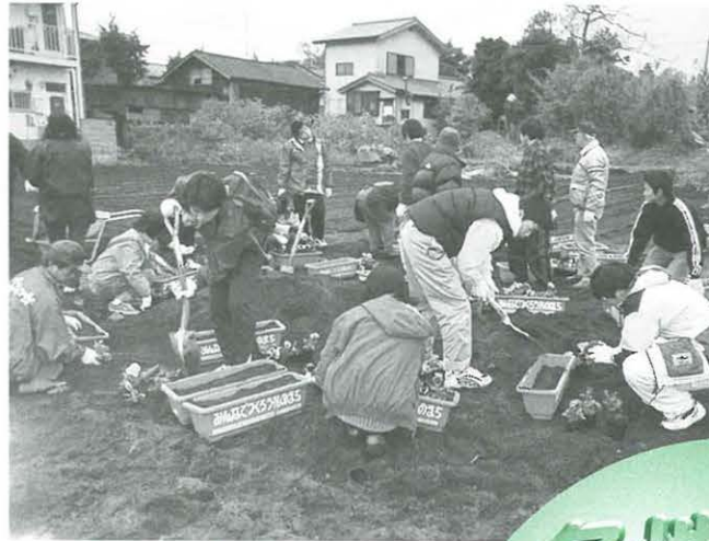
▲金目中学校区教育力ネットワーク協議会 子どもたちがプランターに花を植え、バス停や学校などを飾る「みんなでつくろう花のまち」