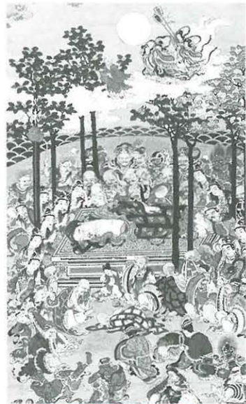
紙本着色涅槃図(部分) 神田寺旧観音寺(博物館寄託)

日時 10月31日(土)～11月3日(祝)、午前9時～午後3時 博物館は、11月7日(日)まで、午前9時～午後5時、11月1日(月)は休館