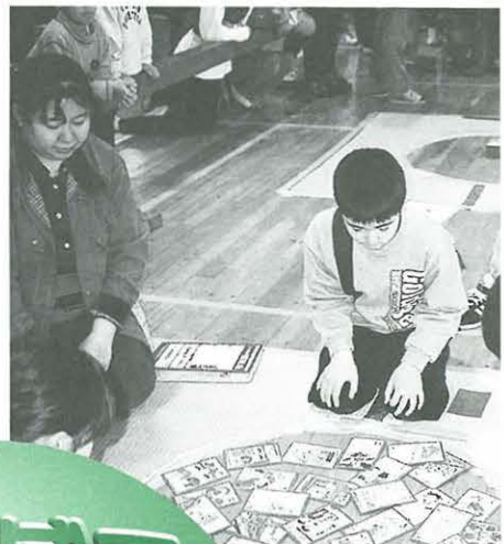
▲港地区青少年地域に足をこてほしいとの「郷土いろはカ」