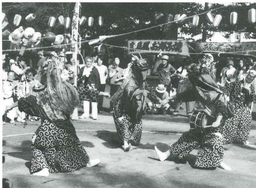
民俗探訪会では県内のまつりを調べます