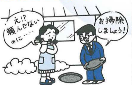
図 下水道総務課(内線2447)

日本下水道協会神奈川県支部や平塚市では、このような清掃や点検をすることはありませんのでご注意ください。また、不審に思ったら、身分証明書の提示を求めるようにしましょう。