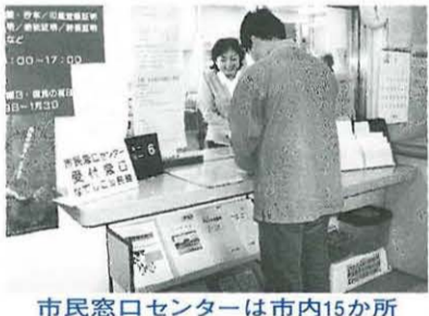
市民窓口センターは市内15か所

市役所に行かなくても、市内十五か所の「市民窓口センター」で、住民票の写しや印鑑登録証明書、住民票記載事項証明、年金現況届、母子健康手帳などがとれます。 ◆場所 なでしこ・大野・豊田・神田・大神・城島・岡崎・金田・金目・土屋・吉沢・旭南