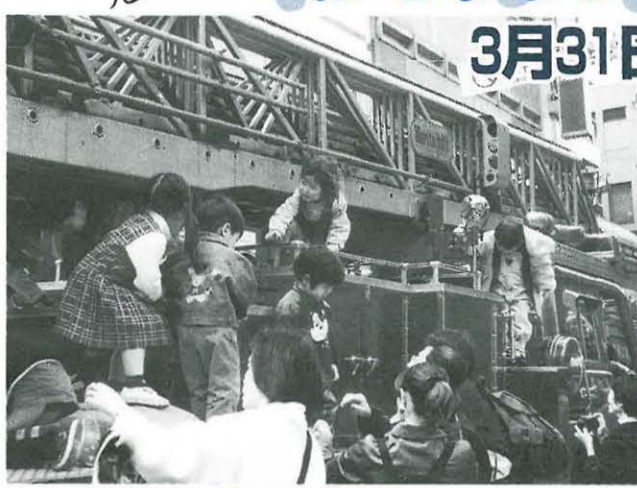
消防車でも遊べるよ

三月三十一日(土) 午前十一時〜午後四時と四月一日(日) 午前九時〜午後五時の二日間、駅前中心商店街で「ルネッサンスまつり」を開催します。