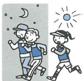
図 スポーツ振興財団(☎35-0102)

◆申し込み方法 5月11日(金)までに大会事務局(☎61-7209)へ「申込書」を請求し、郵便振替でお申し込みください。「申込書」はスポーツ振興財団(総合公園管理事務所2階)でもお配りします