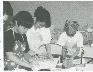
昨年の市民アカデミーから