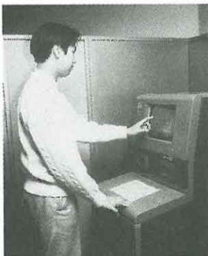
市民用端末機の利用を

二か所に新たに設置する予定です。 ▽提供している情報 ①スポーツ施設、文化施設(図書館、博物館、美術館など)の利用案内を施設へのアプローチの地図とともに提供 ②スポーツ施設の抽選申し込み・抽選結果の確認、空き施設の予約(事前に利用の施設管理窓口で登録し交付された公共施設利用カードが必要) ③スポーツ・文化施設の空き状況の確認 ④スポーツ・文化施設で行われる行事や催し物の情報 ▽利用時間 各施設の開館時間内(毎月第3月曜日と年末年始は除く) ▽問い合わせ先(施設管理窓口) 見附台体育館(☎31-3057)、総合公園管理事務所(☎35-2223)、市民センター(☎32-2223)、中央公民館(☎34-2111)