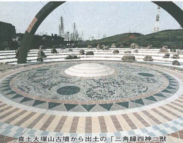
真土大塚山古墳から出土の「三角縁四神三獣鏡」を形どった集会にも利用できる古墳広場

水飲み場など施設内はアイデアもたくさんです。また、施設内はすべてが身体障害者に配慮した設計となっています。ぜひ、ご利用ください。▽問い合わせ みどり公園課(内線647)