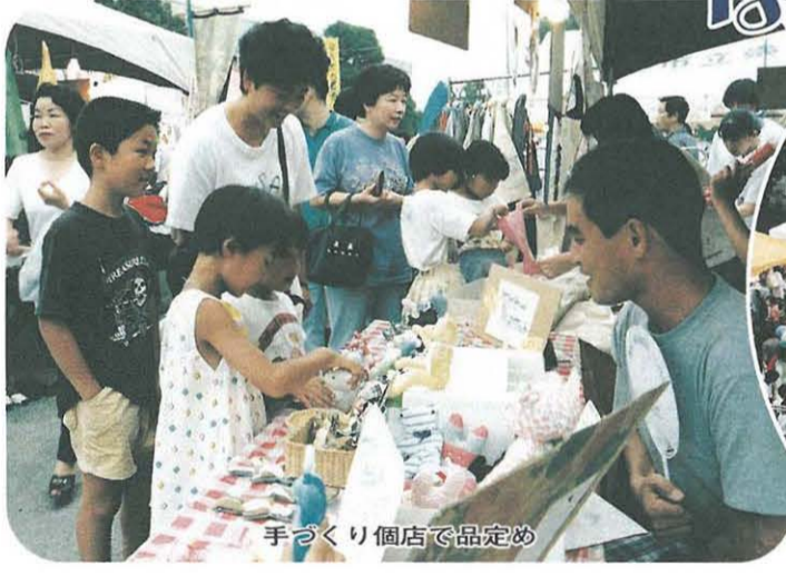
手づくり個店で品定め

求める方が多く見受けられました。特に新鮮な食材などは買い手が早く、早くと売り切れる店が続出し、会場内が活気にあふれていました。