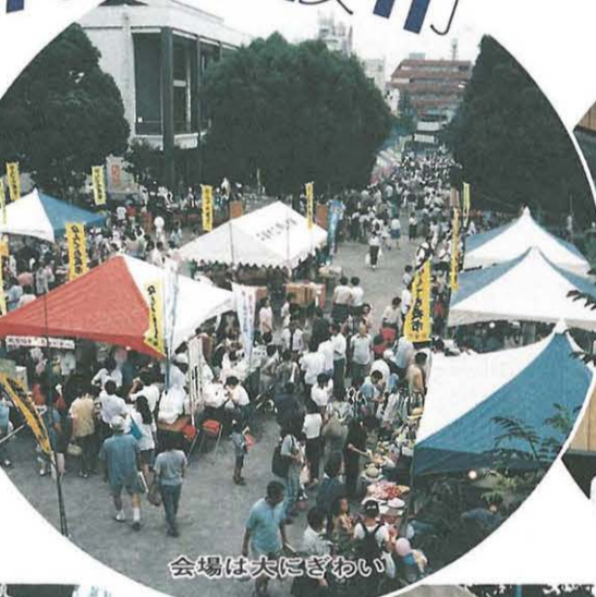
会場は大にぎわい