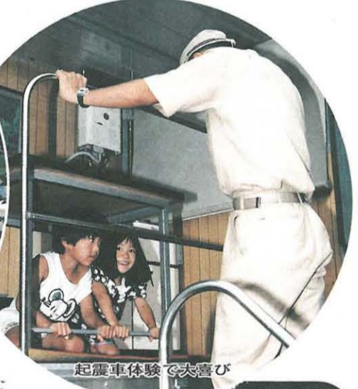
起震車体験で大喜び