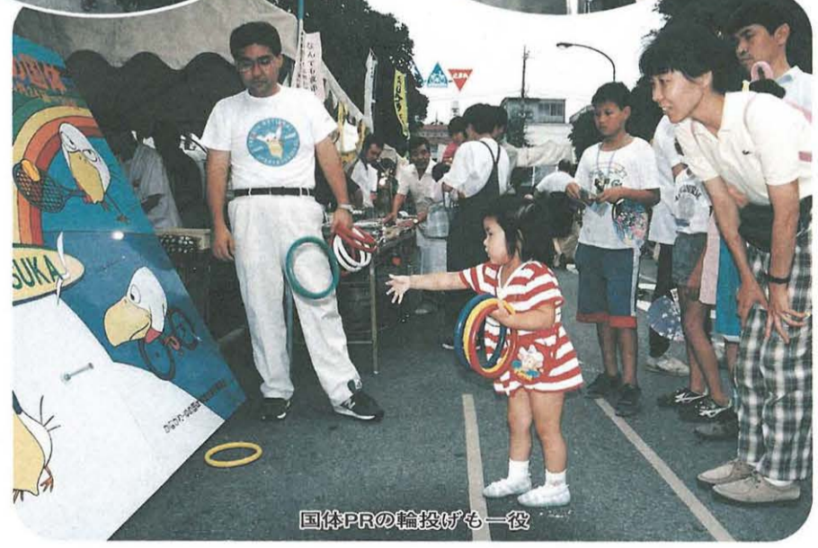
国体PRの輪投げも一役