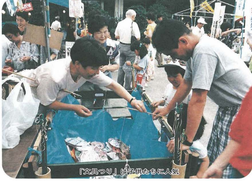
「文具つり」は子供たちに人気