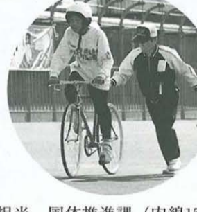
・担当 国体推進課(内線152)