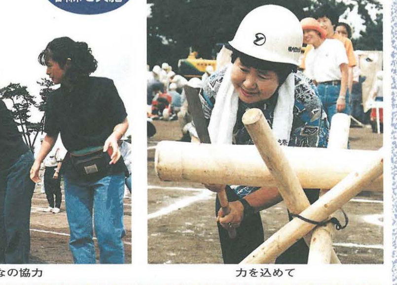
ポイントはみんなの協力 力を込めて