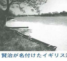
賢治が名付けたイギリス海岸