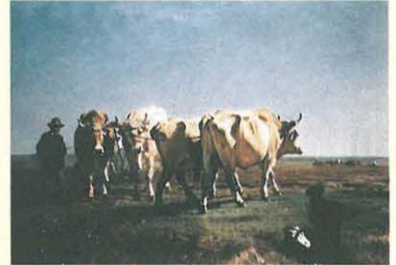
コンスタン・トロワイヨン《耕す牛》ボルドー美術館蔵